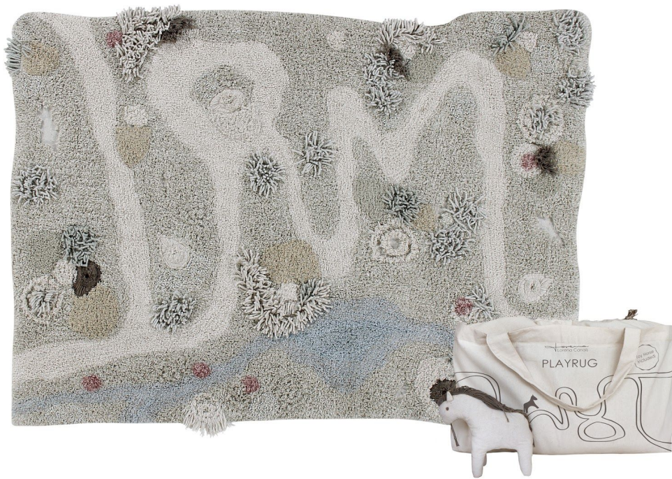
Alfombra de juego lavable Path of Nature - 120 x 160 cm. PVP 229€.

El punto de partida es la icónica pieza Path of Nature , una alfombra de juego que invita a la experimentación de los más pequeños para que relaten sus propios cuentos y vivan infinitas aventuras en el bosque, tomando un pequeño caballo de peluche como protagonista. ¡Como un verdadero paseo por la naturaleza para dejar volar la imaginación!