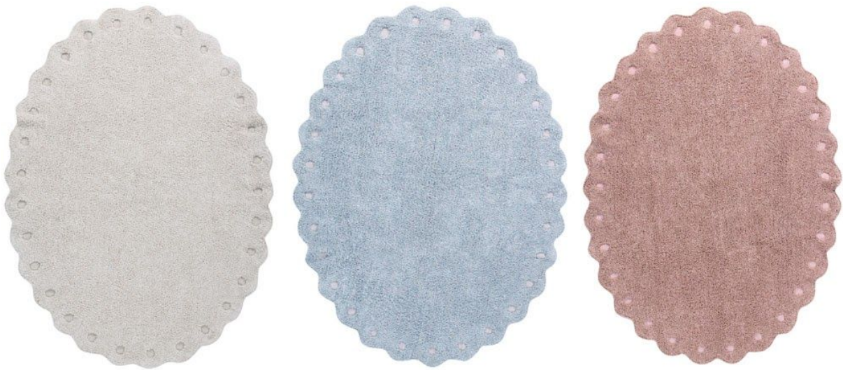
Alfombras lavables Pine Cone - 130 x 180 cm. PVP 145€.

Disponible en tres colores sacados de esta paleta, se confecciona artesanalmente mediante mezclillas de hilos de algodón bicolor , que combinan rosa palo con lino ( Vintage Nude ), azul cielo con gris perla ( Pearl Blue ), y natural con marfil ( Natural Ivory ).