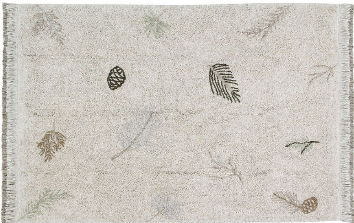
Alfombra lavable Pine Forest - 140 x 200 cm. PVP 229€.

La alfombra Pine Forest es un reflejo de esas pequeñas coleccionas por el bosque siendo niños; de esos aromas y sonidos que nos empapan de su esencia, en una etapa de pleno descubrimiento y conexión con el medio natural .