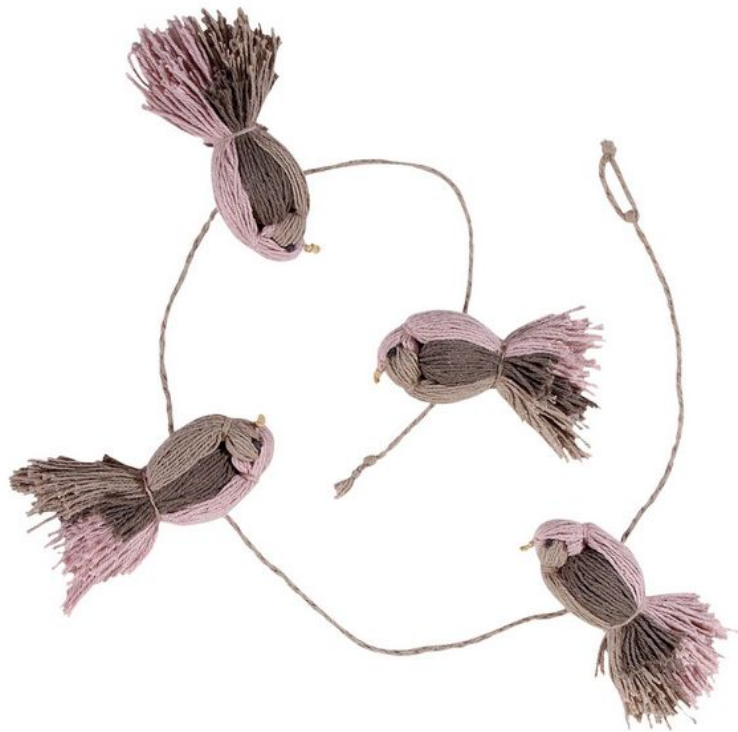
Guirnalda Pío Pío (100 cm. PVP 36€.