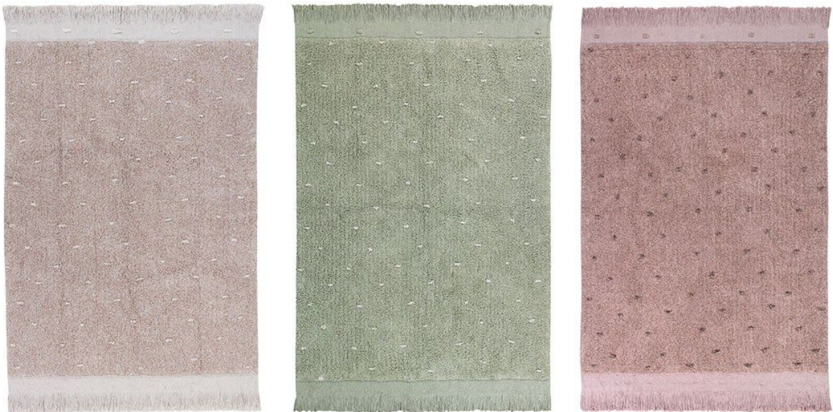
Alfombras lavables Woods Symphony - 140 x 200 cm. PVP 240€.

El suave zumbido de las abejas, los pájaros cantando a lo lejos, el susurro de un roedor que pasa de puntillas; todos estos pequeños sonidos conforman esa especial sinfonía del bosque que ha inspirado el nombre de este diseño. La alfombra Wood Symphony se presenta en tres colores muy naturales – Olive, Linen y Vintage Nude – pensados para llevarse las sutiles tonalidades del bosque a casa . Tiene un fragmento de poesía bordada a mano que lee, The Cotton Song of the Woods .