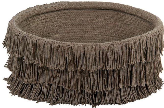
Cesta Pío Pío Nest - Ø40 x 20 cm. PVP 49€.

Una cesta adornada con flecos de distintas medidas, cuya inspiración, como se puede adivinar, proviene del nido de un pájaro escondido en la copa de los árboles.