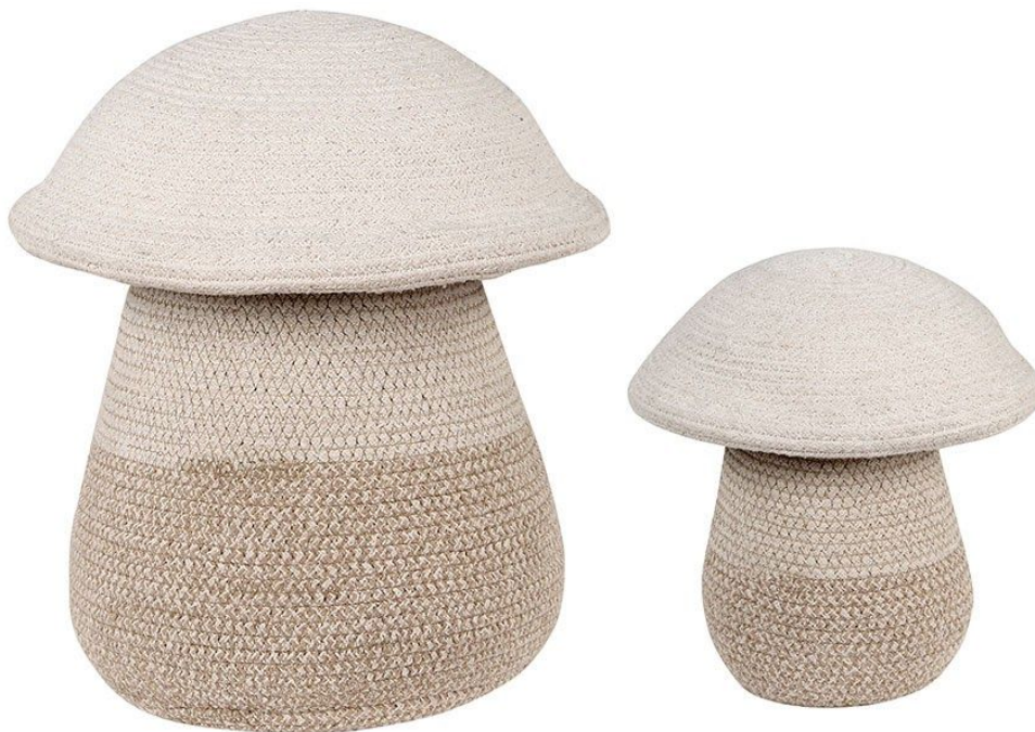
Cesta Mama Mushroom - Ø33 x 38 cm. PVP 49€. | Cesta Baby Mushroom - Ø23 x 27 cm. PVP 39€.

Una fresca y soleada mañana de otoño es ¡el momento perfecto para ir al bosque a buscar setas! Casi como juguetes en sí mismas, las cestas Mama Mushroom y Baby Mushroom se pueden usar tanto juntas como separadas, para guardar los pequeños tesoros. Dos cestas en una, ya que la tapa es como una segunda cesta en forma de cuenco, que puede funcionar por separado, y donde los pequeños pueden echar sus cosas para jugar sin desparramar todo.