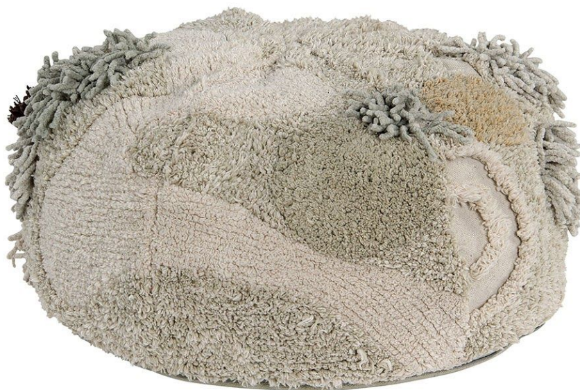
Puff Mossy Rock - Ø50 x 30 cm. PVP 149€.

Como una roca en medio del bosque , redondeada y cubierta de líquen y musgo, que nos invita a sentarnos y a hacer un alto en el camino. El puf Mossy Rock es como el lugar perfecto donde montar el picnic, ¡sólo que ahora será dentro de casa! Y sin preocupaciones, porque ¡es desenfundable y lavable a máquina! El puf Mossy Rock está fabricado a mano en algodón natural , utilizando las mismas mezclillas de suaves tonalidades que en la alfombra Path of Nature , incluyendo los mismos detalles que imitan el líquen y el musgo que crecen sobre las rocas del bosque.