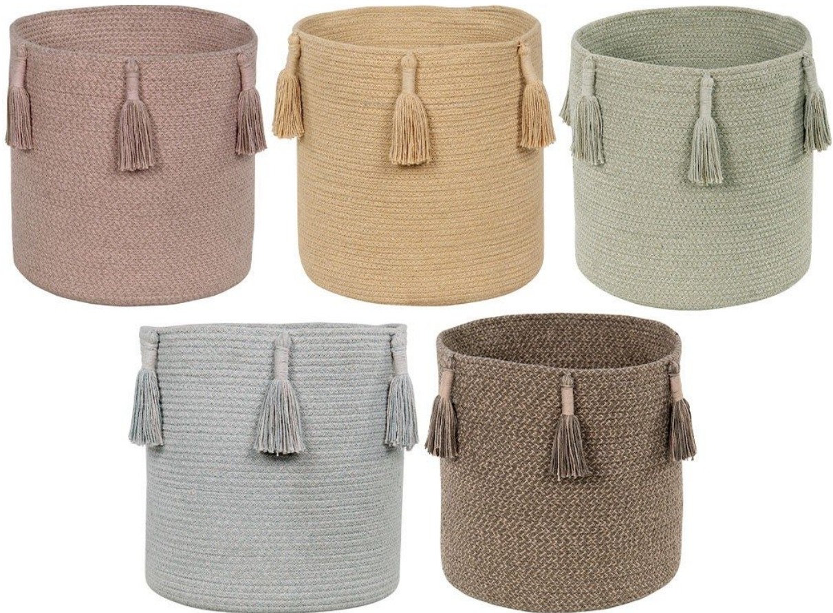
Cestas Woody en hasta 5 colores - Ø30 x 30 cm. PVP 43€.

La cesta Woody está hecha artesanalmente a partir de cordones de algodón bicolor trenzado , que se entremezclan para conseguir una paleta de color de efecto cambiante, inspirada en la naturaleza. Decoradas con una hilera de borlas de tejido mixto y confección artesanal, y disponibles en hasta cinco combinaciones de color distintas: verde oliva claro y oscuro, rosa Vintage Nude y lino, gris perla y azul aguamarina, color miel claro y oscuro, o marrón tierra y lino.