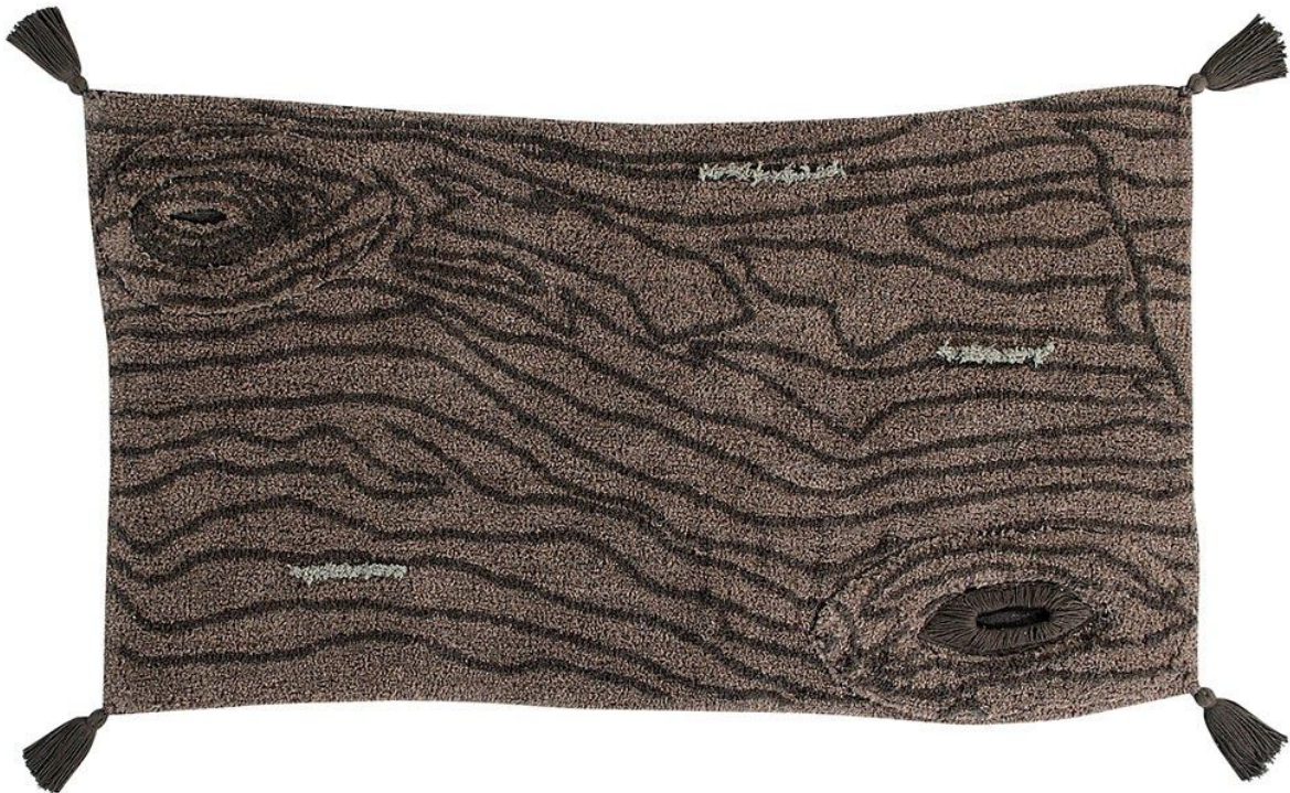
Alfombra lavable Pine Tree - 80 x 140 cm. PVP 125€.

La aventura continúa con Pine Tree , una corteza de pino hecha alfombra. Una pieza cálida que remite al pino mediterráneo y parece destilar vida propia, despertando la imaginación de los más pequeños con su riqueza de acabados de efecto tridimensional.