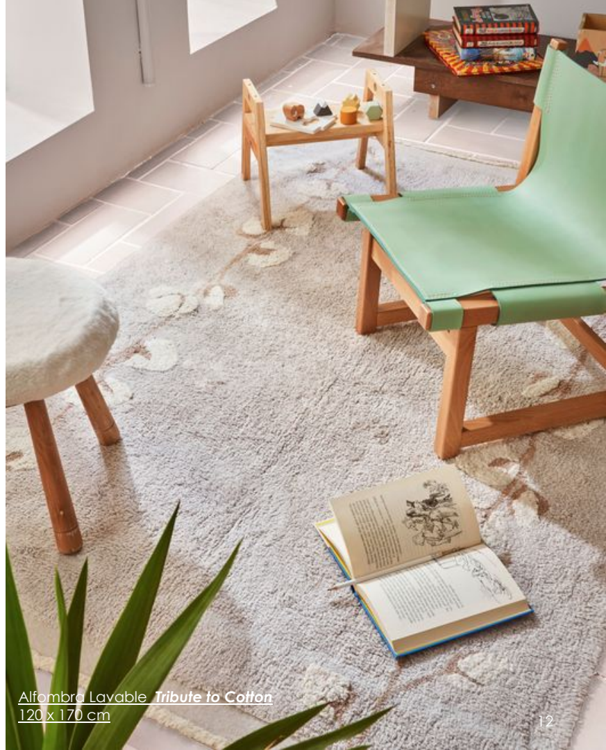
Alfombra Lavable Tribute to Cotton 120 x 170 cm