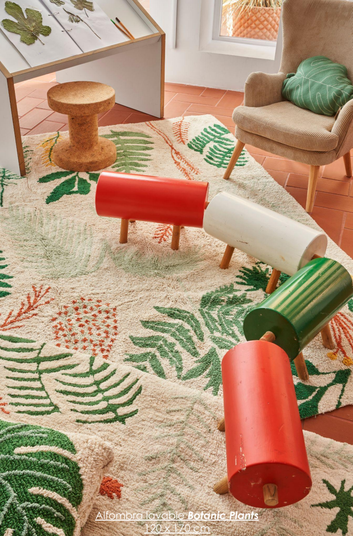
Alfombra lavable Botanic Plants 120 x 170 cm