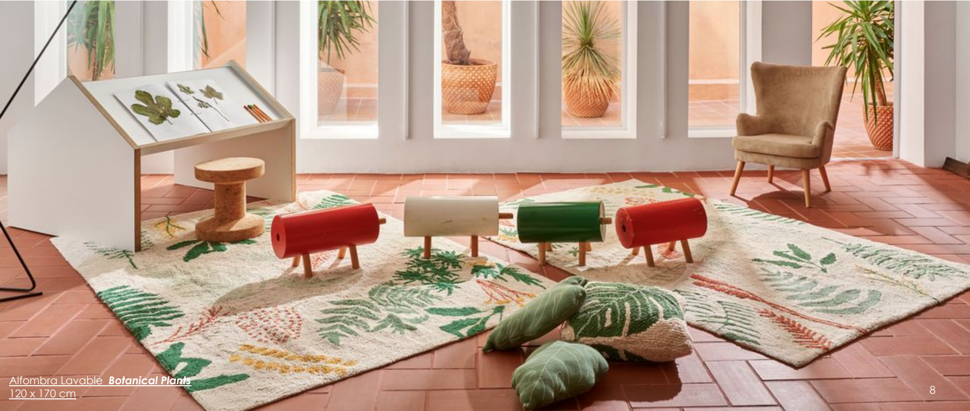
Alfombra Lavable Botanical Plants 120 x 170 cm