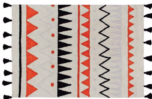
120 X 160 cm | C-AZ-NTE 140 x 200 cm | C-AZ-NTE-L