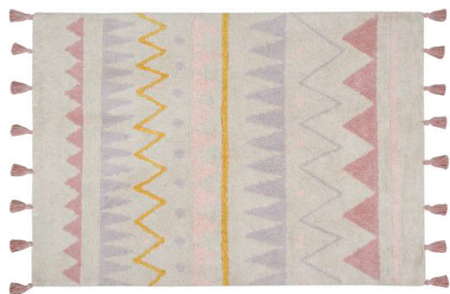
120 X 160 cm | C-AZ-NVN 140 x 200 cm | C-AZ-NVN-L

Peso: 3,5 Kg (120 x 160cm) / 5 Kg (140 x 200cm)