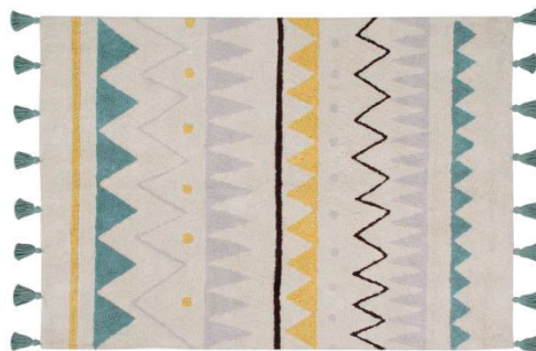
120 X 160 cm | C-AZ-NVB 140 x 200 cm | C-AZ-NVB-L