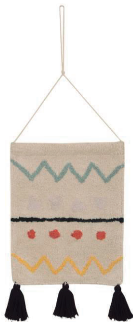
Wall Hanging Azteca

43 cm x 36 cm / 55 cm x 36 cm (approx) | HANG-AZTECA