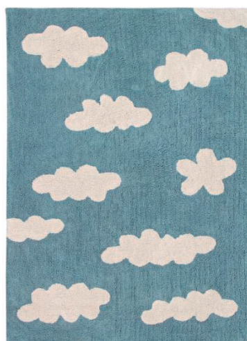
Clouds Vintage Blue 120 X 160 cm | C-CL-VB