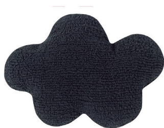
Cloud Negro 50 x 40 cm | SC-CL-BK