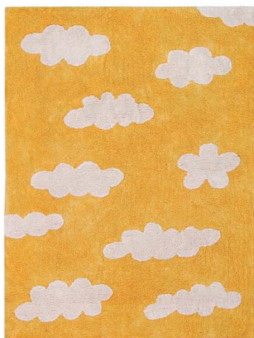
Clouds Mustard 120 X 160 cm | C-CL-MU