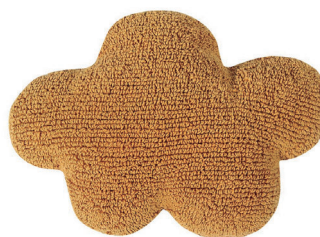
Cloud Mostaza 50 x 40 cm | SC-CL-MU