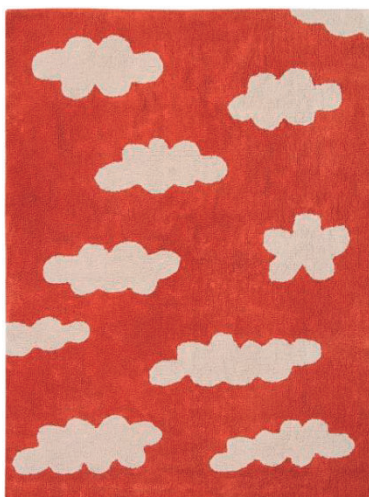
Clouds Terracota 120 X 160 cm | C-CL-TE