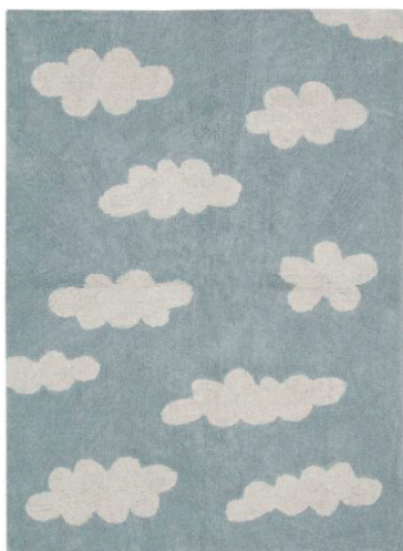
Clouds Grey 120 X 160 cm | C-CL-G