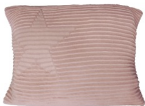
Hippy Stars Vintage Nude 25 x 35 cm | SC-HI-ST-VNU