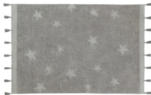
Hippy Stars Grey