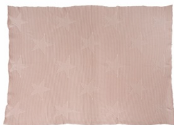
Hippy Stars Vintage Nude 90 x 120 cm | BLC-HI-ST-VNU