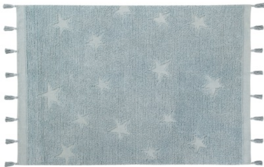
Hippy Stars Aqua Blue