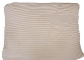
Hippy Stars Natural 25 x 35 cm | SC-HI-ST-NAT