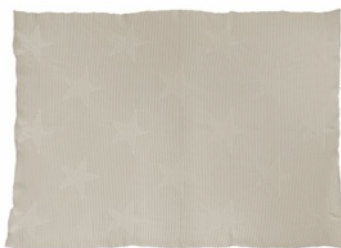
Hippy Stars Natural 90 x 120 cm | BLC-HI-ST-NAT