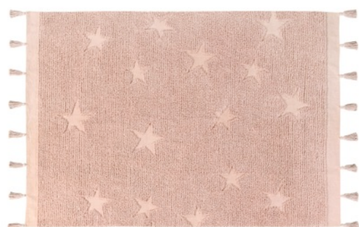
Hippy Stars Vintage Nude