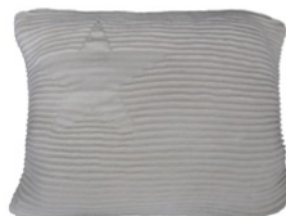
Hippy Stars Pearl Grey 25 x 35 cm | SC-HI-ST-GREY