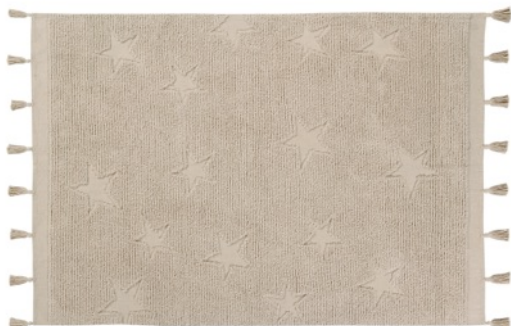
Hippy Stars Natural