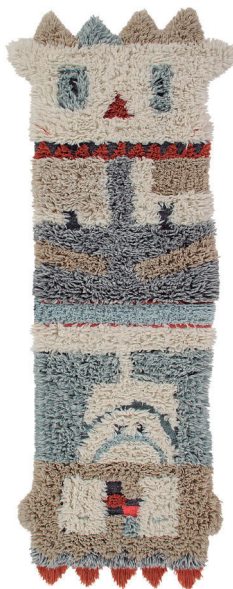
Kachina 90 X 240 cm