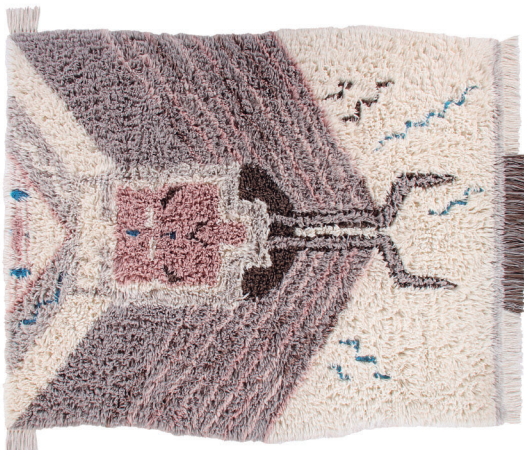
Zuni WO-ZUNI-L 170 x 240 cm