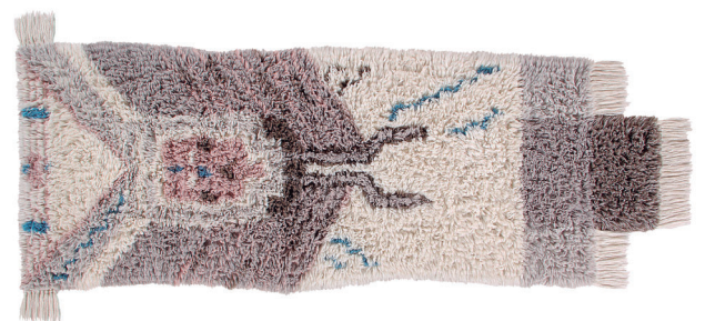
Zuni WO-ZUNI-U 90 x 240 cm