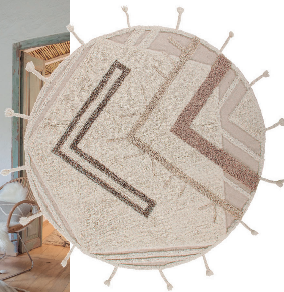
Bannock WO-BANNOCK Ø160 cm

Colores: Natural colors, Sandstone, Moonlight, Almond frost Tamaño lana: Corto en base de algodón color Natural