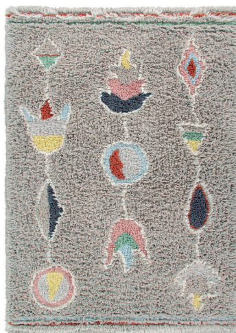
Arizona WO-ARIZONA 170 x 240 cm

UNA MEZCLA DE LANA DE TAMAÑO LARGO Y MEDIANO