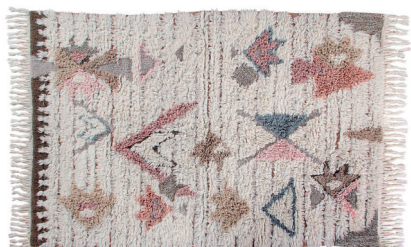
Tuba WO-TUBA-M 140 x 200 cm

UNA COMBINACIÓN DE LANAS DE DIFERENTES COLORES