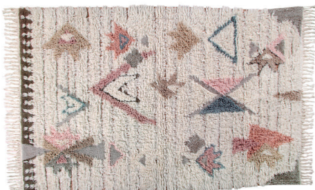
Tuba WO-TUBA-L 170 x 240 cm

DYED BASE IN LINEN COLOR, SLIGHTLY VISIBLE THROUGH THE WOOL PILE