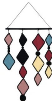
Wall Hanger Assa