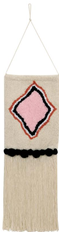
Colgante de Pared Morocco 43 cm x 33 cm / 86 cm x 33 cm (aprox) | HANG-MOROCCO