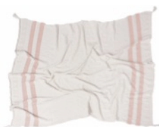
Stripes Natural-Vintage Nude