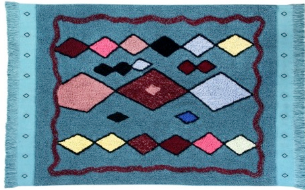
Draa 120 x 185 cm | C-DRAA