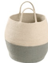
Zoco Vintage Blue