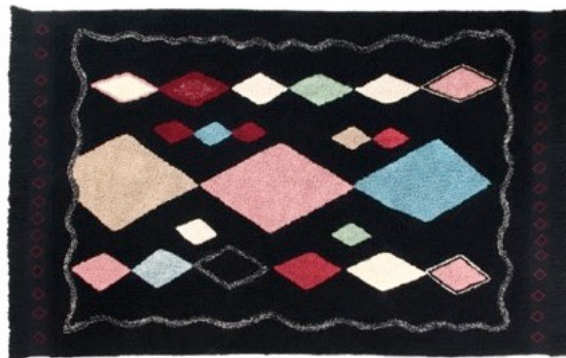
Meknes 140 x 200 cm | C-MEKNES