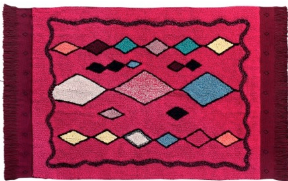
Assa 120 x 185 cm | C-ASSA