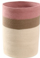
Bazaar Ash Rose