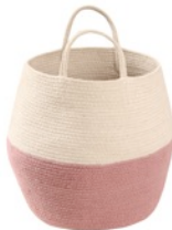
Zoco Ash Rose