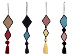
Door Hanger Assa