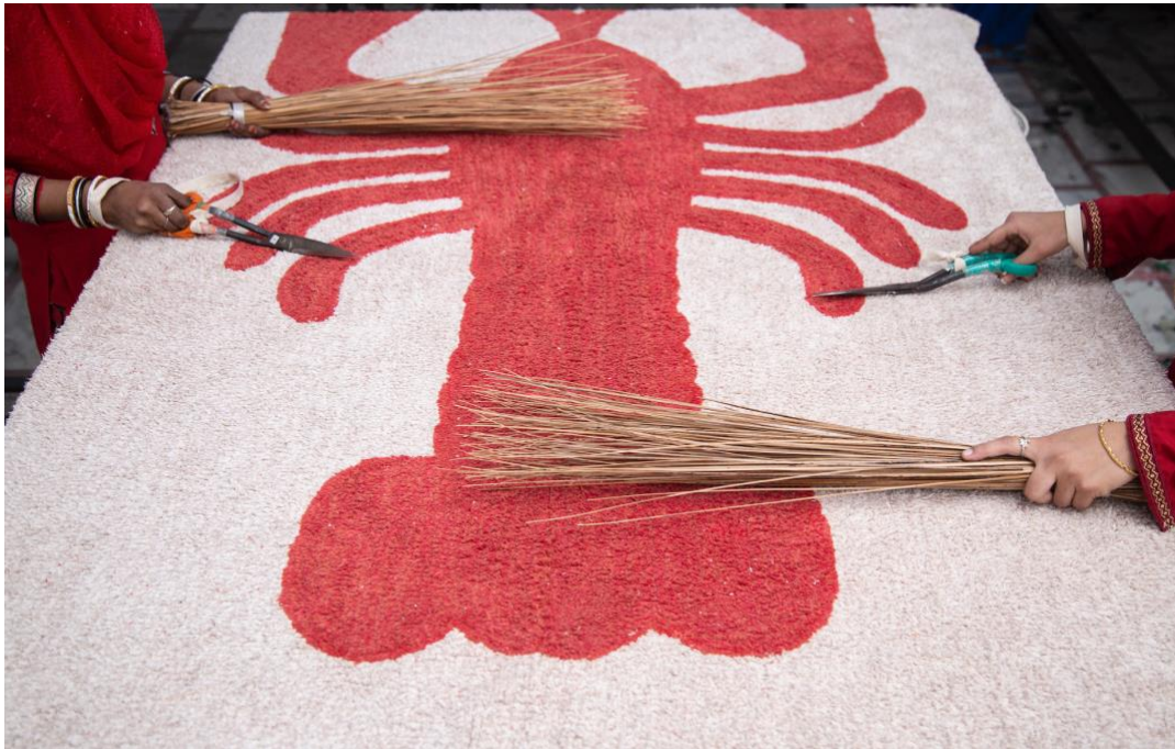
Elaboración de la alfombra lavable Lobster 140x200cm. (245€)

Para Lorena Canals, el seguimiento del proceso de confección y creación en India es muy importante así que la diseñadora trabaja estrechamente junto a su equipo de artesanos para asegurar un entorno de trabajo justo y seguro, que, además, consiguen hacer que cada pieza sea especial y única.