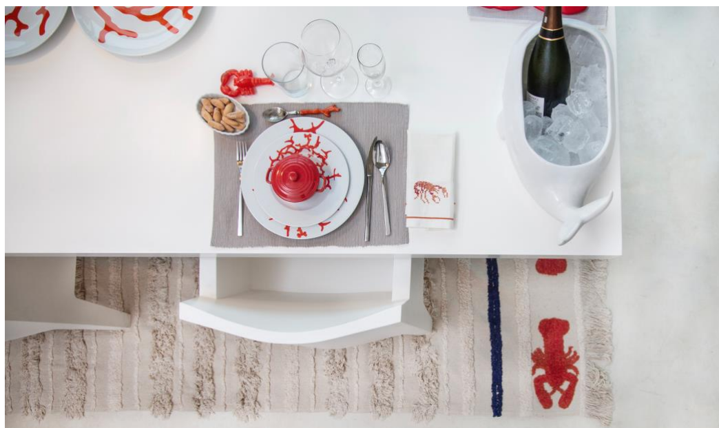
Alfombra lavable Mini Lobster 170x240cm (265€)

El intenso tono rojizo del living coral en las langostas destaca sobre las bases en colores naturales inspirados en la arena fina y blanca de las playas paradisíacas. Un color fresco, joven y lleno de energía que, aplicado al hogar, consigue hacernos vivir un eterno verano. El azul del mar toma forma de finas rayas en azul marino que le dan un toque marinero y fresco a la colección. Toda la colección está elaborada cuidadosamente a mano, una a una, por maestros artesanos en India, con algodón 100% natural y tintes no tóxicos.