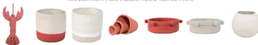
Colgante de puerta Door Lobster 50x30cm. (25€), cestas Mini Tricolor Natural y Ivory 15x15x15cm. (15€), pack de 3 cestas Terracota en forma de macetas 30x30cm, 20x20cm y 13x12cm (59€), cestas tray Brick Red y natural 12x30x30cm (34€) y cesta Bola Ivory 30x30cm (34€).