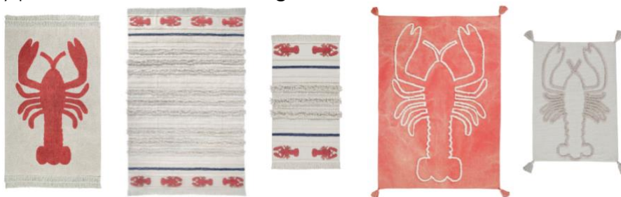
Alfombras lavables Lobster 140x200cm. (245€), Mini Lobster 170x240cm (265€), Mini Lobster XS 80x140cm (79€), tapices de pared Giant Lobster Brick Red 200x140cm. (155€) y Lobster Natural 100x70cm. (39€)

Nuevas técnicas de elaboración. Para el acabado desgastado del tapiz de pared Giant Lobster se ha utilizado una técnica con la que se consiguen piezas únicas. En ellas, el acabado y los tonos no se repiten. El modelo de alfombra Mini Lobster , disponible en 2 tamaños, consigue diferentes texturas y grosores gracias a la utilización de varias técnicas de cosido sobre la base canvas. De esta manera, además de una original y atractiva textura, se consigue aligerar la pieza y permite ofrecer tamaños grandes.