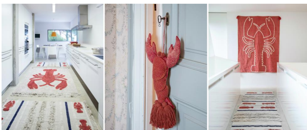
Alfombras lavables Lobster 140x200cm. (245€), Mini Lobster XS 80x140cm (79€), Mini Lobster 170x240cm (265€), colgante de puerta Door Lobster 50x30cm. (25€) y tapiz de pared Giant Lobster Brick Red 200x140cm. (155€)

Abril de 2019.- Lorena Canals presenta su nueva colección Lobster , con la que la diseñadora refleja su pasión por el mar y, en especial, por las langostas. Una colección que convierte a este animal y al living coral, color del año 2019, en los protagonistas principales de alfombras, tapices y cestas lavables llenas de energía y vitalidad.