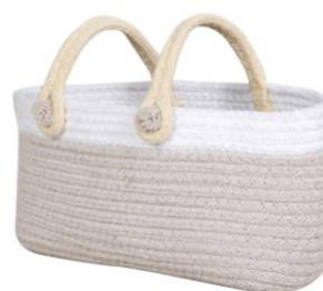
Cesta María 12x25x25cm. (23€)

Cada uno de los motivos de la colección Pyjama Party es un guiño a sus colecciones más emblemáticas como los detalles bereber, los topos, los flecos y los acabados trenzados.