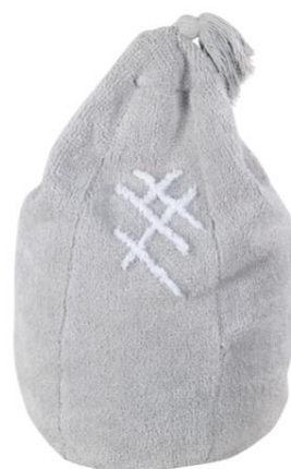
Puff Siesta 80x50x50cm. (149€)

Otra de las novedades de esta colección infantil es la práctica cesta "María" de algodón trenzado en forma ovalada con asas, diseñada para colgarla de la cuna y poder tener a mano todo lo que necesita el bebé.