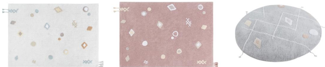
Alfombras de algodón lavable Kim 140x220cm. (229€), Noah 140x220cm. (229€) y Sleepover Puff Lou 8x120x120cm. (179€)

Con la alfombra "Lou" Lorena Canals ha diseñado una nueva categoría de producto a la que ha llamado Sleepover puff . Consiste en un diseño 2 en 1 que aúna la calidez de sus alfombras con la comodidad de un pouffe. Un producto redondo, moldeable y fácil de desplazar que entusiasmará a pequeños y mayores. Su relleno extraíble hace que se convierta en pouff o alfombra según las necesidades de cada momento.