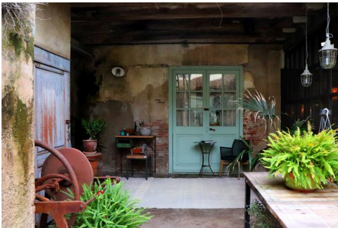
La nueva colección de algodón lavable Re-Edition es una reedición de diseños esenciales e icónicos de la firma a lo largo de su historia

Con esta nueva colección Lorena Canals Roura vuelve a su esencia transformando diseños que originalmente fueron pensados para bebés en versiones elegantes y actuales para toda la casa. Su amor y respeto por el medio ambiente así como su compromiso con los productos ecológicos han marcado el objetivo principal de la colección: llevar la tierra y la naturaleza a todo el hogar.