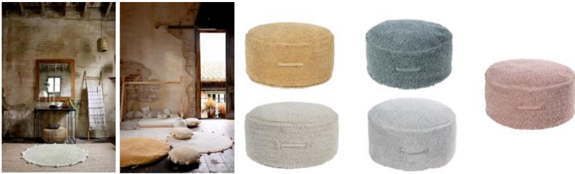
Alfombras de algodón lavable Bubbly 120x120cm (89€) y Hippy Dots 120x160cm (129€), cojines de suelo Bubbly 48x48cm (49€) y Sleepover Pouffe Lou 120x120cm (179€)

Se amplían también los pufs de la colección Pyjama Party con el nuevo color miel que se añade a los vintage blue, gris perla, ivory y vintage nude.